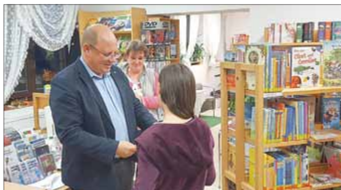
Simone Lesser Stadt- und Kurbibliothek

„Ich bin eine Leseratte“ ist ein erfolgreiches und beliebtes Freizeit-Lese-Projekt der Hessischen Leseförderung und der Landesfachstelle für öffentliche Bibliotheken in Thüringen mit Unterstützung der Sparkassen-Kulturstiftung Hessen-Thüringen, an dem in den letzten Jahren bereits zahlreiche Bibliotheken begeistert teilgenommen haben.