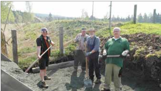
Mitglieder des Schützenvereins bei der Arbeit