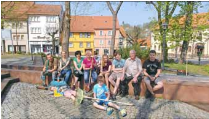
Der Posaunenchor bei einer Pause