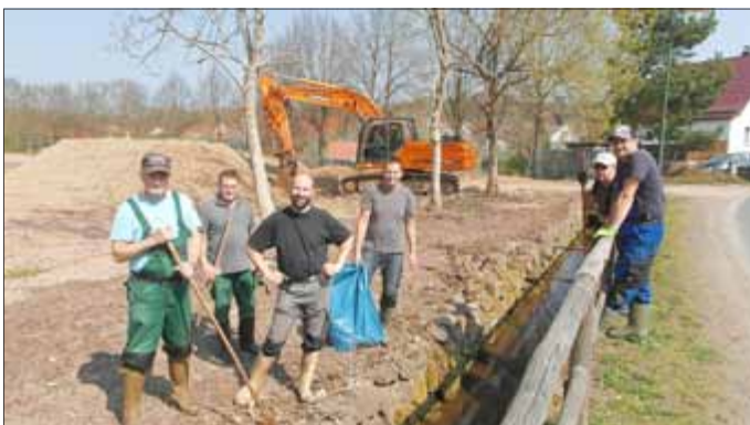
Der Angelverein bei der Gewässerpflege an der Ochenswiese