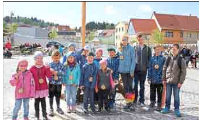
© Ecki - Sieger im Kindersägen

Platz 3: Thomas Prinz und Horst Bauer („7 Täler“- Opas)