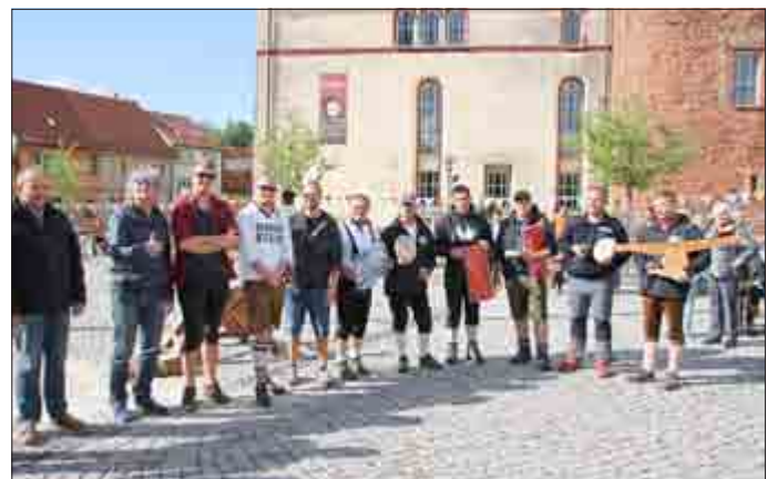
© Ecki - Sieger im Säge-Vereinswettbewerb Männer

Nochmals herzlichen Glückwunsch an alle Sieger und ein Dank an alle Anderen für ihre Teilnahme.