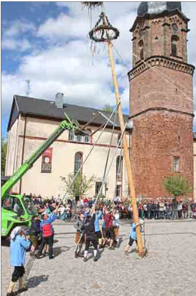
Maibaumstellen