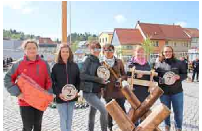
© Ecki - Sieger im Säge-Vereinswettbewerb Frauen