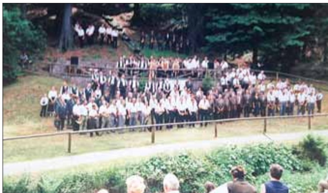
1998 - 30 Jahre Jagdhornbläsergruppe Rennsteig am Lutherbrunnen im Tammichgrund

Wir hoffen, wir sehen uns am 01. September 2018 ab 14.00 Uhr auf unserer Ochsenwiese. Bleibt schön gesund. Wir freuen uns auf euch