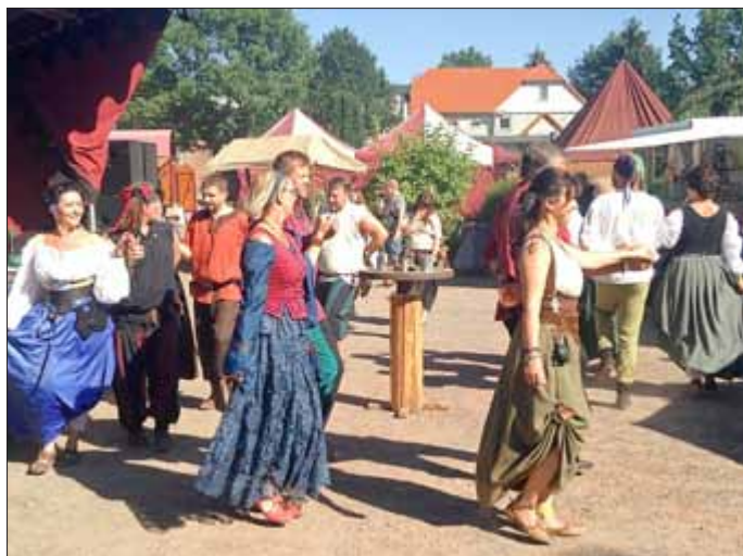
Tanz in der Schänke „7 Täler“