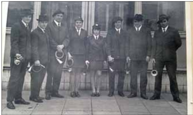
Jagdhornbläsergruppe Rennsteig

50 Jahre Jagdhornbläsergruppe Rennsteig aus Tambach-Dietharz - wer erinnert sich nicht gern an die vielen Sonntage auf der VEM.