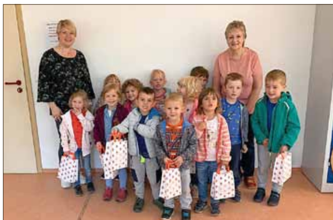
Die Erzieherinnen der Zugvogel, Amsel- und Meisengruppe der IB Kita