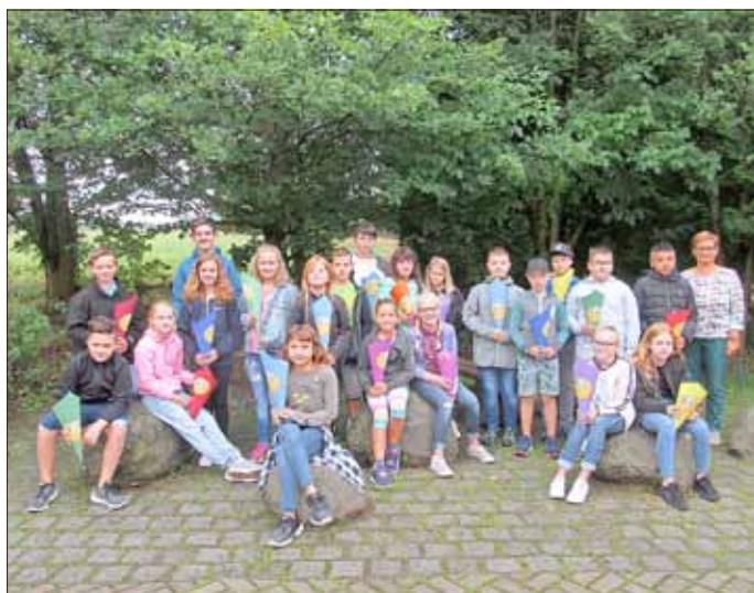
Unsere neue 5. Klasse