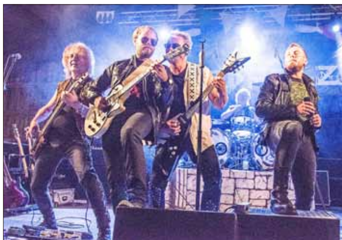
Hardholz feiert Jubiläum.

Tambach-Dietharz im Thüringer Wald bietet mehr als seine malerische Landschaft inmitten von 7 Tälern und zwei Talsperren. Hier existiert eine lange musikalische Tradition vieler Bands. Rückblickend gab es Kapellen wie die Musette-Gruppe und die Blackies in den 1960er und 70 Jahren, später die Bergvagabunden, aber auch Rock- und Metalbands wie Orakel, Löwenzahn, The Thors, AudioXperience, Hardholz und Eisregen, um nur einige zu nennen.