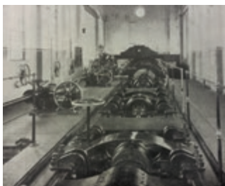
Wasserkraftanlage Berka/Werra 1909