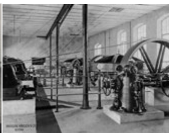
Überlandzentrale Mihla/Werra 1910

Zu Beginn der Elektrifizierung am Anfang des 20. Jahrhunderts war die Wasserkraft in Thüringen die einzige einheimische Energiequelle. Die Einführung von Wasserturbinen an Stelle der bisherigen Wasserräder erfolgte zeitlich etwa parallel mit der Einführung der Elektrizität. Die Vernachlässigung der Wasserkraft zu DDR-Zeiten führte zu einem weitgehenden Niedergang. Seit 1990 kam es zu einer Renaissance der Wasserkraftnutzung auch im thüringischen Werragebiet.