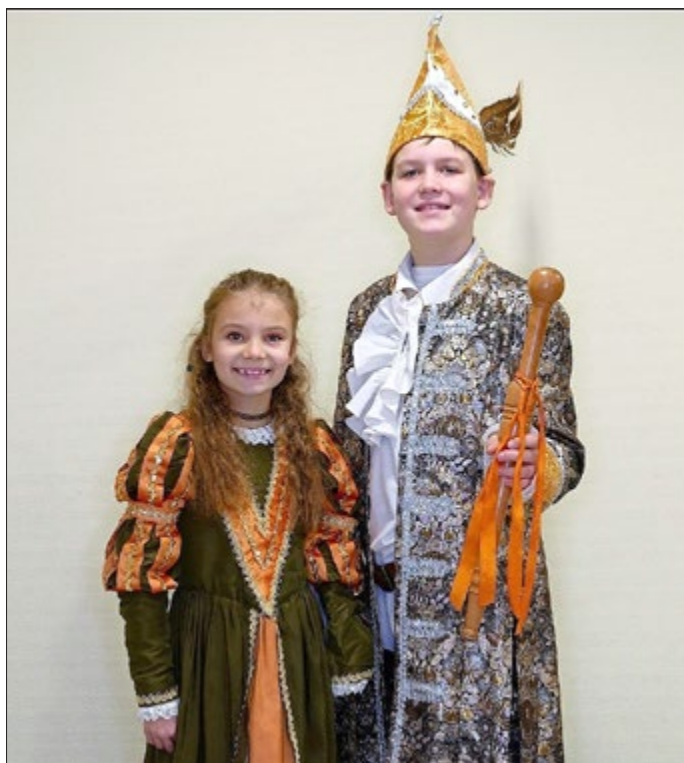
Tammich und Detersch Helau!