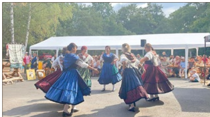
„7 Täler“ Frauenreigen