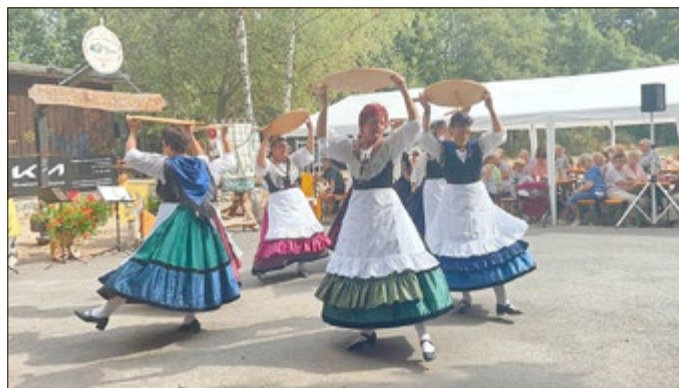
„7 Täler“ Kuchenschellentanz

Und das war es auch schon wieder für 2022 - der 17. Heimatnachmittag war ein sehr schöner Tag mit vielen Trachtenfreunden und tollen Gästen. Wir haben dieses Jahr unser 20-jähriges Vereinsjubiläum ein wenig nachfeiern wollen, was wir denken bei Kaffee und vor allem leckeren Kuchen ein wenig gelungen ist - danke an unsere vielen Backfrauen hier im Ort. Das Wetter spielte super mit, nicht zu heiß wie an vielen Tagen zuvor oder danach. Somit konnten wir die 3 Stunden, die wie immer im Pfluge vergingen, mit Tanz und Gesang gut füllen.