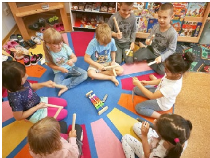
Ihr Team des Lutherkindergartens

Mit besonderer Freude und Konzentration musizieren die Vorschulkinder mit klingendem Schlagwerk (nach dem Komponisten und Musikpädagogen Carl Orff auch „Orff-Instrumente“ genannt). Ganz nebenbei wirkt sich das Musizieren bei den Kindern positiv auf die Aufmerksamkeit, Selbstkontrolle, Teamfähigkeit und auf die Persönlichkeitsentwicklung insgesamt aus.