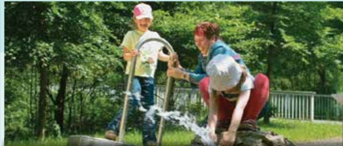
barrierefreie Spielstation im Schmalwassergrund