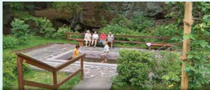
Kneipp-Anlage im Schmalwassergrund (Mai bis Oktober)