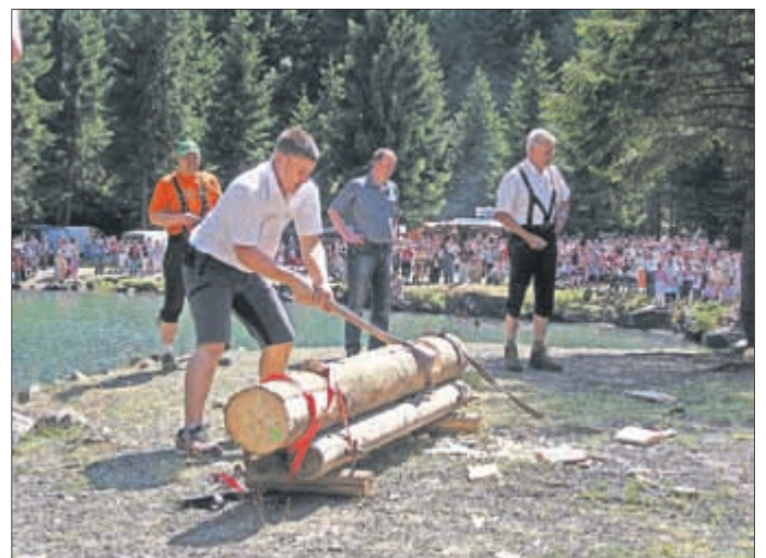
Säge- und Holzhackwettbewerb

Trotz Algenplage wird auch in diesem Jahr mit Musik, Spaß, Spiel und guter Verpflegung sowie dem traditionellen Säge- und Hackwettbewerb zwischen beiden Gemeinden, gefeiert!