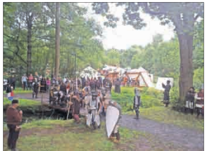
Die Brückenschlacht um die Wasserechte