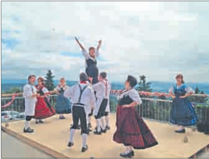
10. Thüringer Landestrachtenfest in Brotterode am 14.06.2014