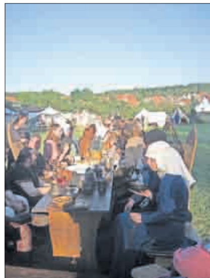
Die längste Tafel von Dietharz, mit 140 hungrigen Teilnehmern