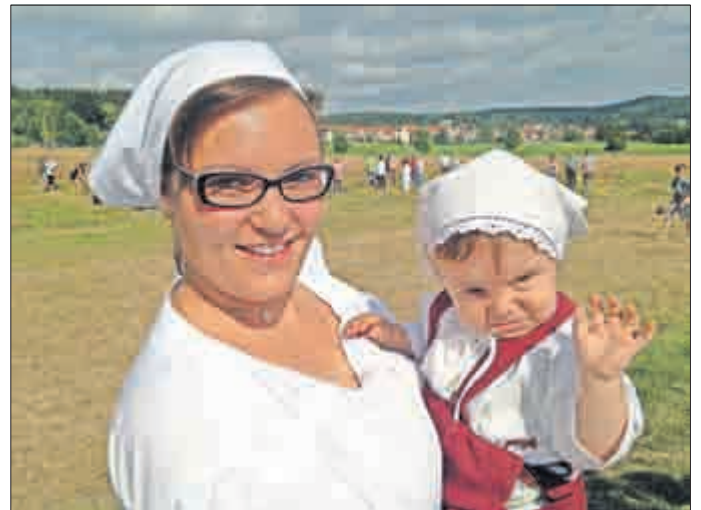
... und zum Mahdwettbewerb!

Zum Abschluss möchte ich Ihnen allen noch von der letzten, der 51. EUROPEADE in Kielce (Polen), berichten. Auch hier waren die „7 Täler“ mit zwei Paaren vertreten. Mit ihnen und Vertretern des Landestrachtenverbandes Thüringens sowie dem Wechmarer Heimatverein wurde offiziell die Europeadefahne an die polnische Stadt Kielce zur Ausrichtung der 51. Europeade übergeben. Es war, wie im letzten Jahr, ein bewegender Moment und eine tolle und ereignisreiche Europeade in Polen. Wir hoffen, auch im nächsten Jahr zur 52. Europeade in Helsingborg (Schweden) einige Paare unseres Vereins entsenden zu können.