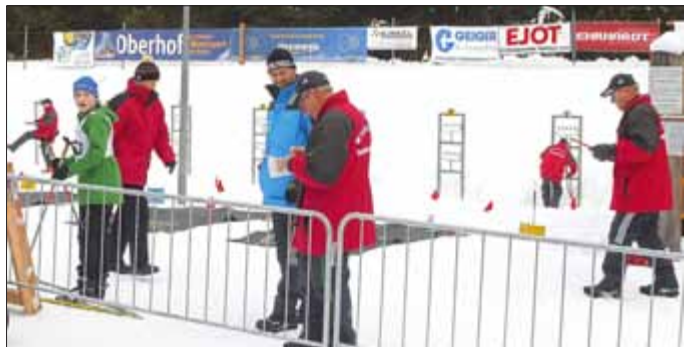
Kampfrichter bei der Arbeit