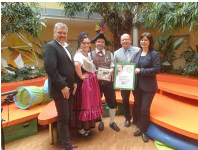
Übergabe der Spendenbox im Kinderhospiz in Tambach-Dietharz