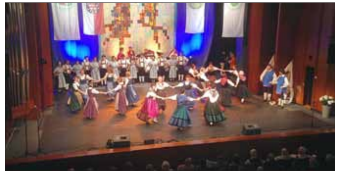
Mädchenreigen der Landestrachtengruppe

In diesem Frühjahr jagt wieder ein Highlight das andere. Wir, die Tänzer der Thüringer Trachtengruppe der Sieben Täler e. V. durften am 20.05.2017 mit an der 1. THÜRIADE, die anlässlich des 20jährigen Jubiläums des Thüringer Landestrachtenverbandes e.V. in Gotha im Kulturhaus statt fand, teilnehmen.