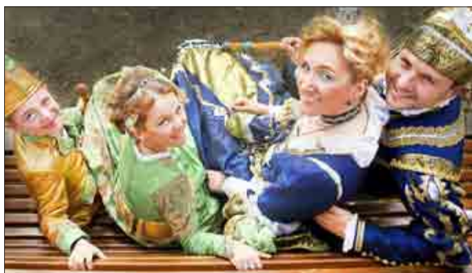
Prinzenpaare der 49. Saison - wer folgt ihnen zur 50. Saison? Am 11.11. ist es soweit!

Hallo Ihr Narren , kommt herbei, zu Jux und Tanz und Tollerei!